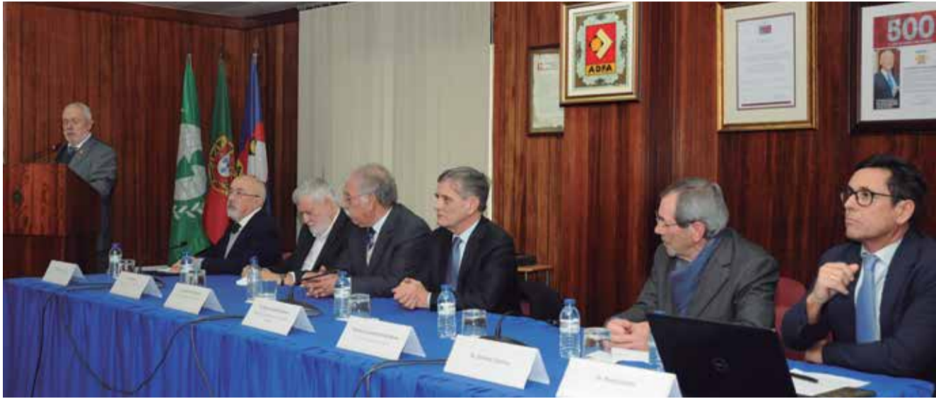
Entidades na Mesa de Honra e à chegada ao evento

Secretário de Estado preside à Sessão Solene na Sede Nacional