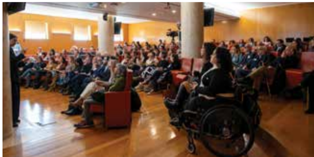
Este Estudo Nacional pode ser consultado online

Para o efeito, foi realizado um questionário por telefone a uma amostra representativa da população portuguesa, com idades compreendidas entre os 18 e os 65 anos. O trabalho de campo, que decorreu entre 1 e 30 de Outubro último, foi da responsabilidade da E.M. Estudos de Mercado, tendo sido recolhidas mil respostas válidas, no continente e ilhas, com uma margem de erro de +/- 3,10%, para um nível de confiança de 95%. O questionário utilizado desdobrava-se em cinco secções: (A) Caracterização sociodemográfica das pessoas inquiridas; (B) Contacto e conhecimento sobre a deficiência; (C) Posicionamento face às pessoas com deficiência; (D) Representações, estereótipos e discriminação; (E) Políticas de apoio a pessoas com deficiência.