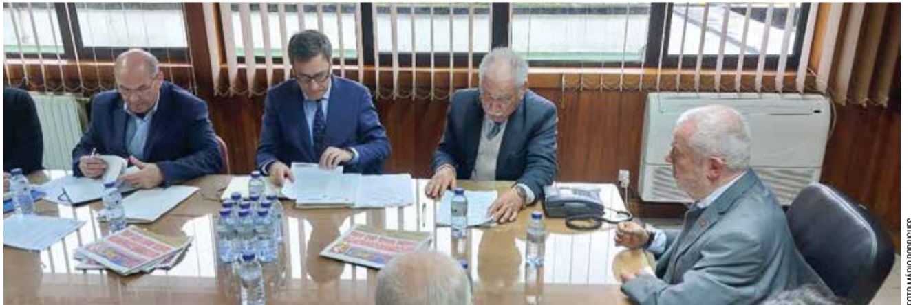
O director-geral, o subdirector-geral e os presidentes da MAGN e da DN durante a visita e reunião