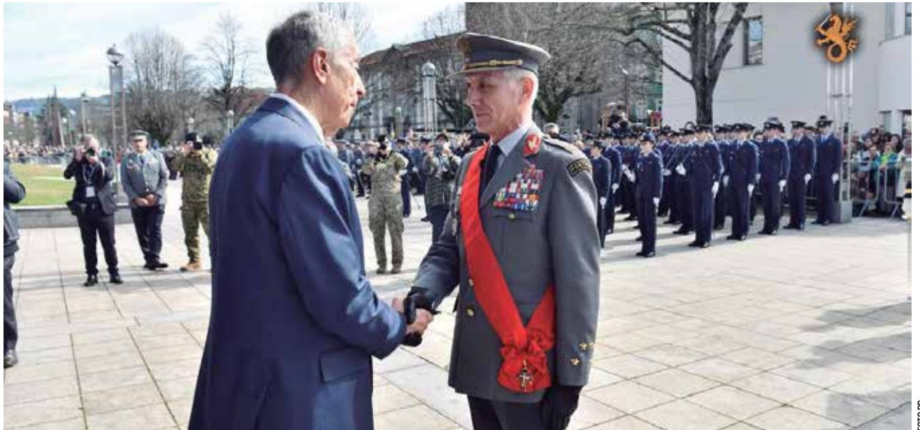
Marcelo Rebelo de Sousa cumprimenta o CEMGFA

Na sua intervenção, o ainda Chefe do Estado manifestou “ reconhecimento pelo profissionalismo, dedicação e sentido de missão demonstrados pelos militares portugueses, em território nacional, como no cumprimento de compromissos internacionais, sublinhando o contributo das Forças Armadas para a afirmação de Portugal enquanto País empenhado na Paz, no apoio e protecção à salvaguarda dos bens e pessoas e na cooperação internacional ”.