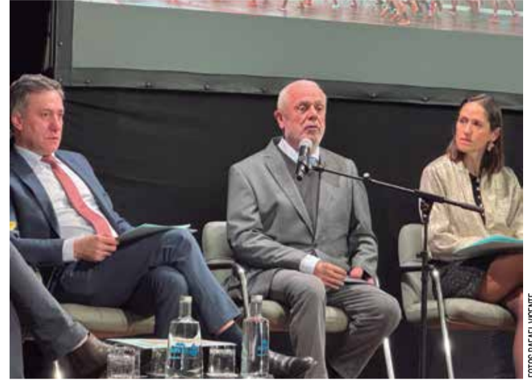
Os intervenientes na cerimónia de apresentação e o presidente da DN no uso da palavra

O evento Running Challenge - Trail Linhas de Torres 2026 foi apresentado no dia 25 de Fevereiro, numa conferência de imprensa realizada na Casa da Música Francisco Alves Gato, no Complexo Cultural Quinta da Raposa, em Mafra. A cerimónia contou com a presença de representantes dos municípios, associações e entidades civis e militares que compõem a organização do evento, de entre as quais se destaca a ADFa.