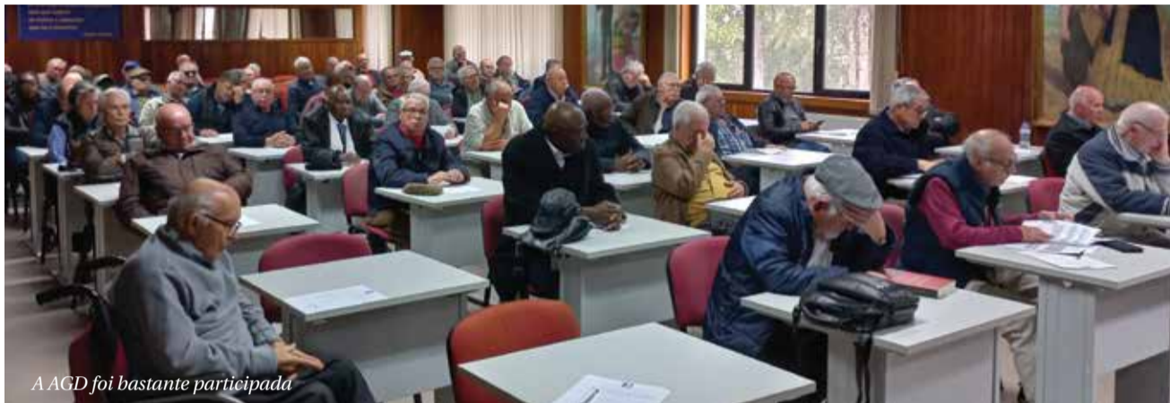
A AGD foi bastante participada

Assembleia-Geral da Delegação e Conselho da Delegação