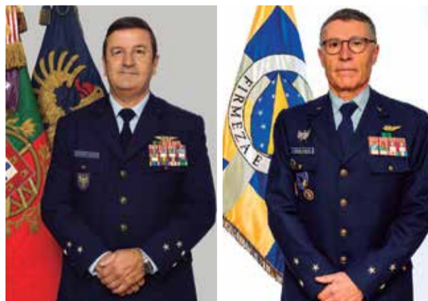
O novo CEMGFA