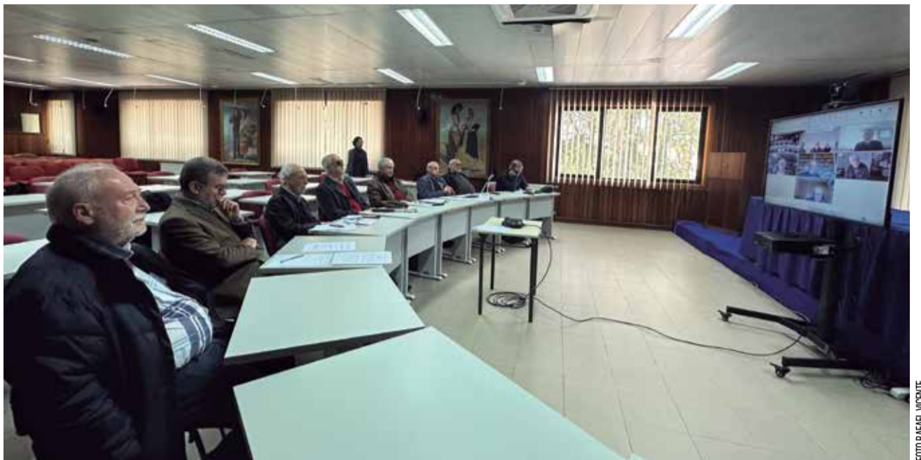
O GT aprovou o cronograma das actividades a realizar

No ponto prévio da ordem de trabalhos, o assunto em análise mereceu cuidada atenção e forte indignação.