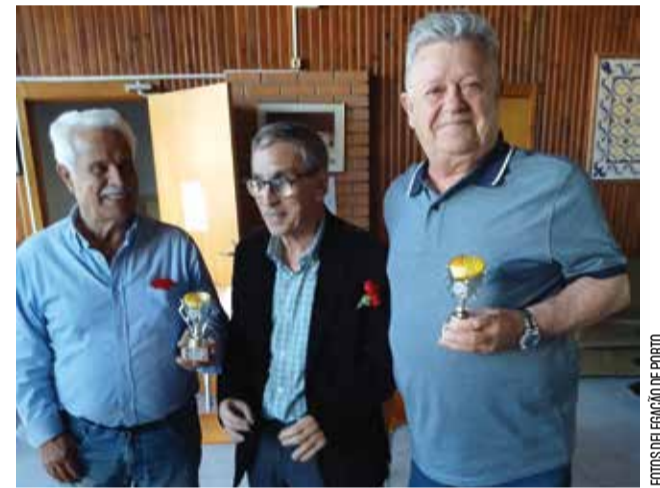
O convívio foi animado durante o Torneio de Sueca

O Torneio de Sueca consiste numa competição do jogo de cartas, com uma tradição de várias décadas, sempre no dia 25 de Abril.