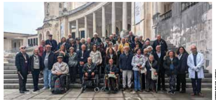
A Delegação organizou uma visita sem barreiras arquitectónicas

Durante a tarde, o grupo visitou o Centro de Interpretação da Batalha de Aljubarrota (CIBA), em São Jorge, onde participou numa visita guiada e assistiu ao espectáculo multimédia “A Batalha Real”, que recria os acontecimentos que antecederam a Batalha de Aljubarrota, em 1385. A jornada terminou com um momento solene de deposição de uma coroa de flores junto ao Túmulo