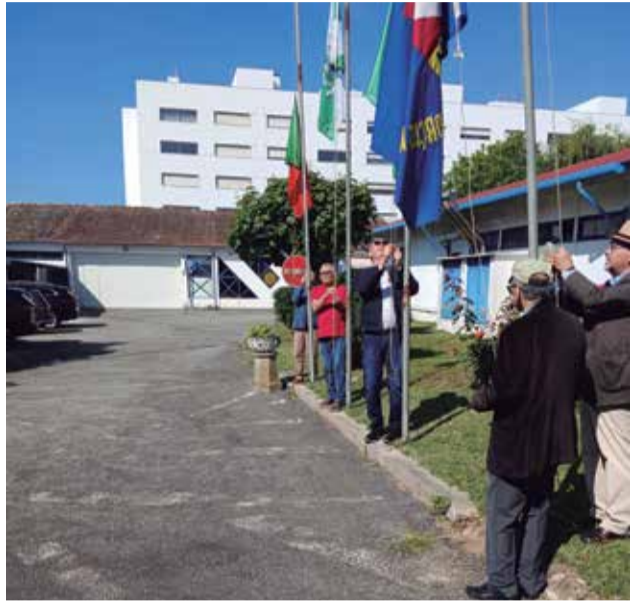
Momento do hastear das bandeiras

O 52.º Aniversário do 25 de Abril foi comemorado na Delegação, com a realização de um programa que teve início às 10h30, com o hastear das bandeiras, ao som do Hino Nacional.