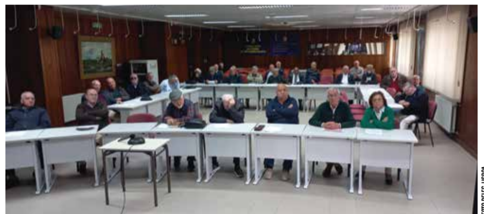
Os associados tomaram conhecimento da audição da DN na Assembleia da República