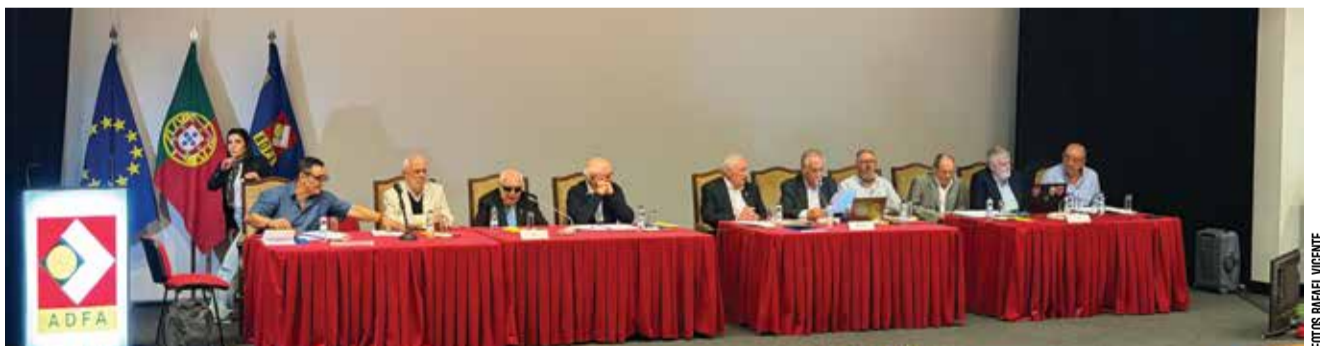
Os associados tomaram conhecimento da audição da DN na Assembleia da República