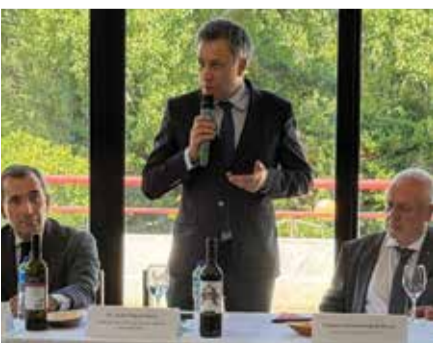
Dr. Pedro Vieira, subdirector-geral de Recursos Humanos da Defesa Nacional