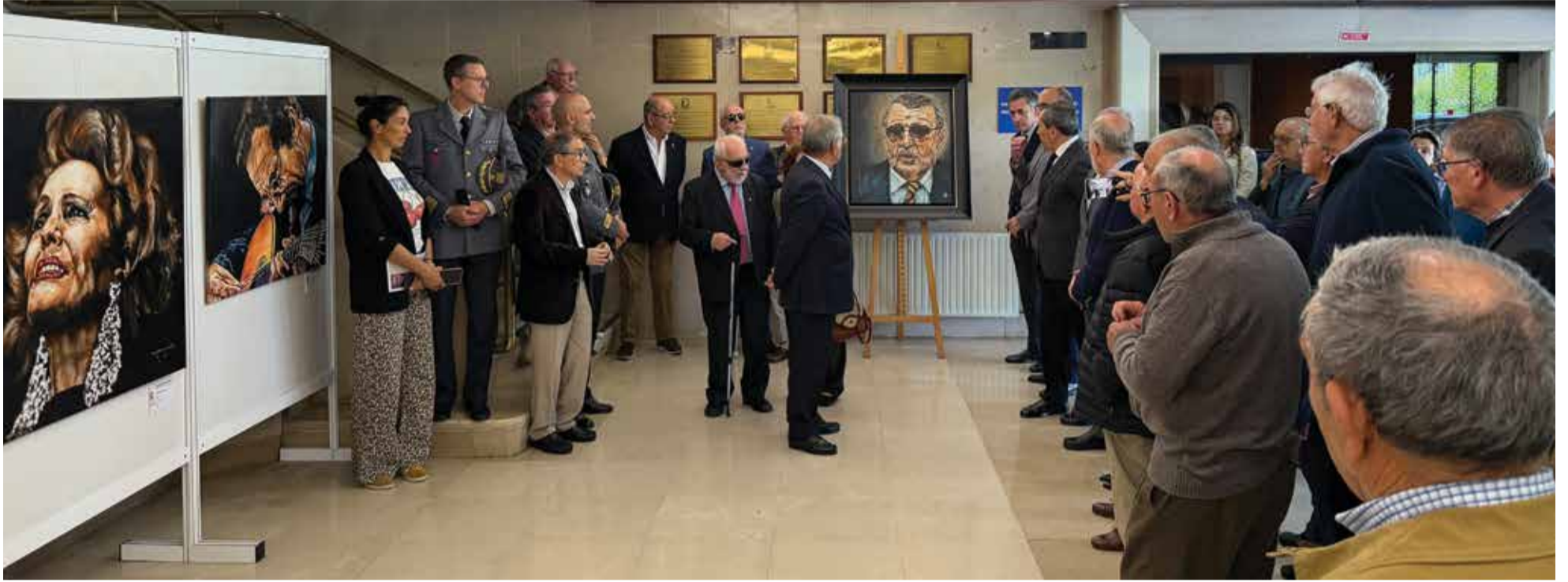
Momento de inauguração da exposição colectiva de pintura