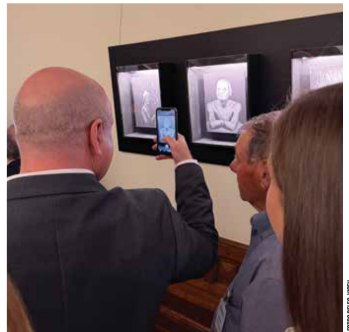
O presidente da Assembleia da República apresentou a exposição fotográfica “Despojos de Guerra”, de Leonel de Castro

D epois de ter passado pelo Centro Português de Fotografia, no Porto, a Exposição Despojos de Guerra , da autoria do fotógrafo Leonel de Castro, chegou à Assembleia da República, em Lisboa, onde estará patente, entre 27 de Maio e 26 de Junho, no Andar Nobre.