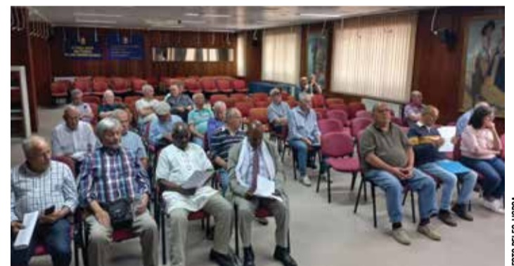
Os associados sempre atentos, durante a reunião