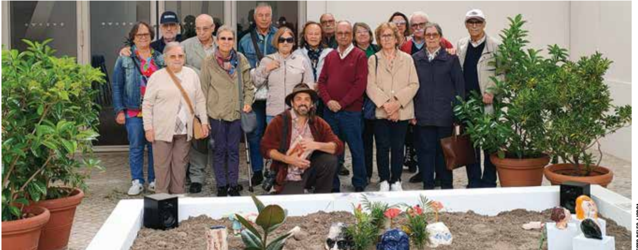
O grupo animado posa durante a visita à Exposição