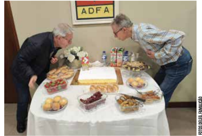
A Delegação agradece a presença dos associados e familiares

A Delegação de Famalição celebrou o seu Aniversário, como Delegação da ADF A mais antiga do País, no dia 19 de Maio, cumprindo 52 anos de actividade em prol dos associados. Para assinalar esta data tão especial, a Direcção da Delegação decidiu promover uma comemoração diferente, marcada pela proximidade