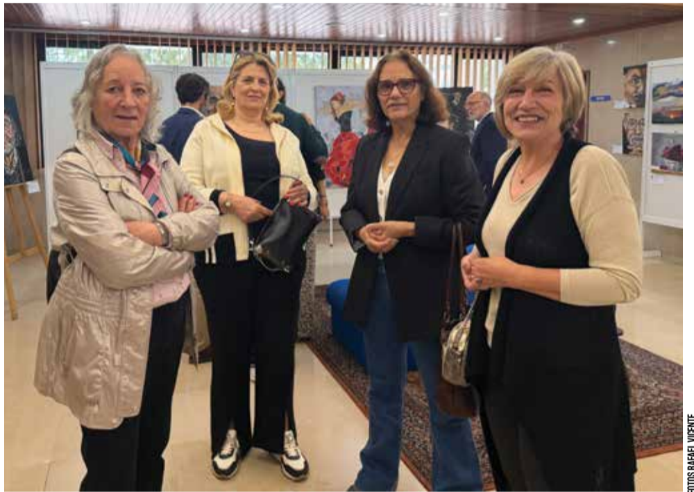
Sorrisos femininos entre as cores da exposição

No dia 14 de Maio, a ADFA celebrou o seu 52.º Aniversário, na Sede Nacional, em Lisboa, com a inauguração de uma Exposição Colectiva de Pintura intitulada “ para além da tinta, a alma ”, com trabalhos de alguns associados, familiares e amigos que anteriormente frequentaram as aulas de pintura na Associação, e com um almoço-convívio, no Restaurante da Sede Nacional.