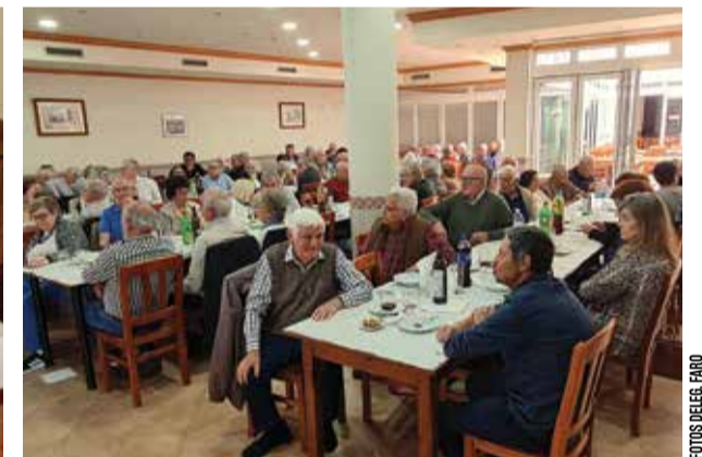
A Delegação agradece a presença dos associados e familiares

Decorreu no passado dia 9 de Maio, no Restaurante Austrália , em Faro, o almoço-convívio de celebração do Aniversário da Delegação de Faro, no qual confraternizaram aproximadamente 90 pessoas, entre asso-