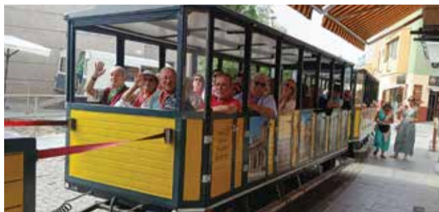
Momentos de diversão e convívio durante a viagem

Nos dias 23 e 24 de Maio realizou-se o tradicional passeio da Delegação de Coimbra, desta vez à região da Extremadura Espanhola.