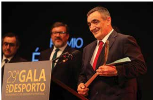
Emoção no momento de agradecer o Prémio

Ao longo da sua carreira, destacou-se como dirigente, treinador, árbitro internacional e responsável por missões desportivas de elevada relevância. Desempenhou funções como vice-presidente do Comité Paralímpico