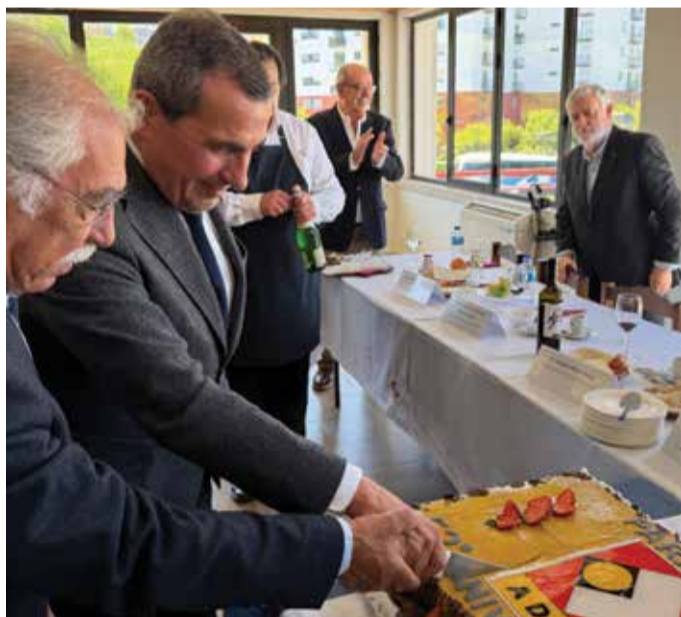
52.º Aniversário ADFA

Celebramos e não esquecemos. Comemorámos o nosso 52.º Aniversário com as entidades com quem interagimos diariamente, na defesa dos direitos inalienáveis de todos os deficientes das Forças Armadas. Mostrámos que ainda falta cumprir a dignidade e o completo reconhecimento e reparação que permitam encerrar definitivamente o dossiê da Guerra Colonial. Ainda há quem sofra e as questões relacionadas com a nossa saúde preocupam-nos dramaticamente. Ao celebrar mais um ano de actividade intensa e ininterrupta, trazemos a memória ao presente, para que o País e a República não esqueçam aqueles que deram o melhor de si pela Pátria, regressando feridos na mente e no corpo da Guerra Colonial. Portugal não esquecerá, pois a ADFA mantém firme as suas reivindicações.