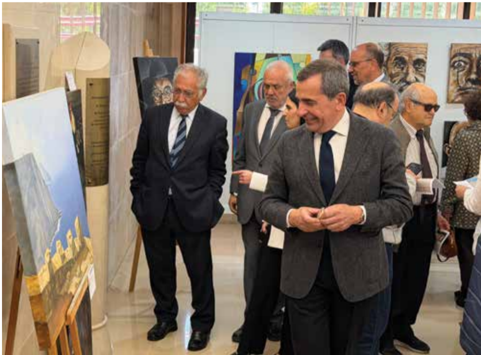
Presidente da Magn, presidente da DN e secretário-geral do MDN