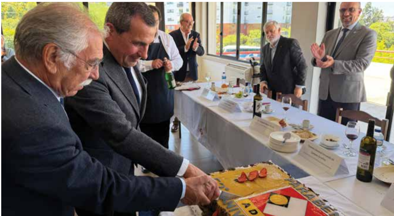
Corte do bolo de aniversário